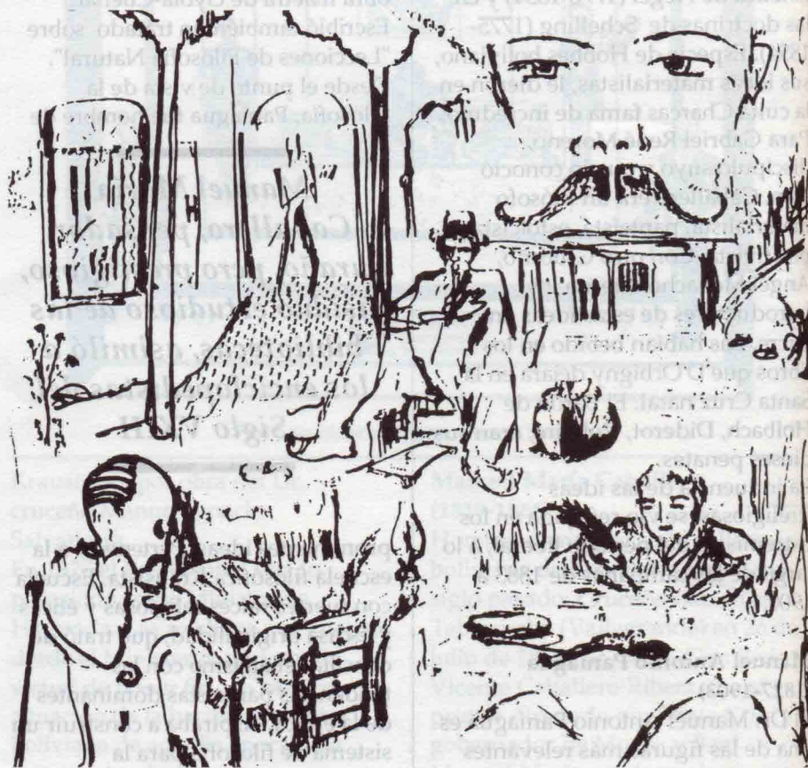
Ilustración del libro con la silueta de los Pensadores Cruceños

responsabilidad y disciplina. Realizó sus estudios primarios, secundarios y universitarios en su ciudad natal, titulándose de abogado en 1943. Dejando de lado las actividades de su profesión, se dedicó a la disciplina de su predilección, la Filosofía, de la que daría muestras de ser un excelente maestro y dedicado cultor. Entre los años 1946 y 1970, inició un largo recorrido por diversas Universidades latinoamericanas de Brasil, Chile y Venezuela, siempre