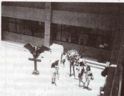
1) Jesucristo Superstar, 2) Mundo, la destrucción a través de los vicios, 3) sueños, puerta de un lado la pureza del otro el caos

Las posibilidades de almacenamiento de datos, sonidos e imágenes se incrementan gracias a las memorias de las computadoras o los videodiscos; la capacidad de tratamiento y cálculo aumenta en proporciones sumamente considerables mediante los microprocesadores; las posibilidades de transmisión a través del espacio se acrecientan merced a los satélites de comunicación en la superficie terrestre o bajo el mar con la utilización de ondas de hiperfrecuencia o de fibras ópticas; el acopio de datos, por último,