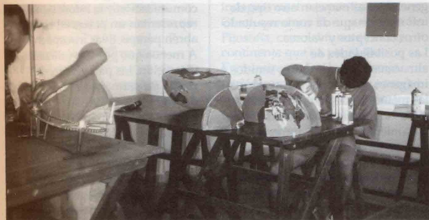
lza. Estudiantes trabajando. Der. Imágenes de collage con guerra, destrucción, conectada con rayo o fuerza superior que hace posible que se mantenga sana.

En términos genéricos, Morfología es la ciencia de las FORMAS, la cual investiga las ideografías del Arte y de la Naturaleza; y la ideografía, es la expresión de las ideas por imágenes o símbolos. Según el diccionario, Morfología es parte de