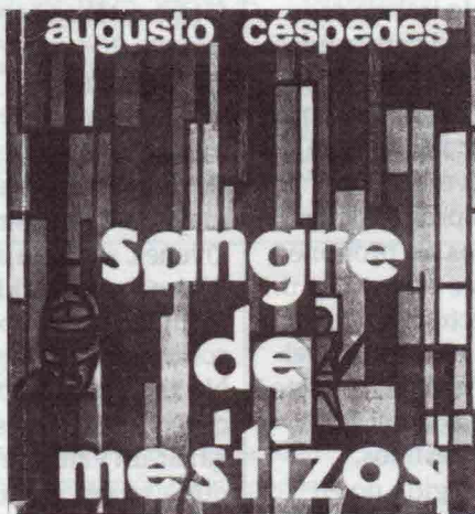
Portada del libro de Augusto Céspedes "Sangre de Mestizos"

El relato presenta generalmente un estado inicial de cosas y un cambio de estado que puede o no realizarse. Existe la hipótesis de que el hombre realiza permanentemente una serie de acciones en la búsqueda por recuperar un estado inicial paradisíaco de armonía. El cambio