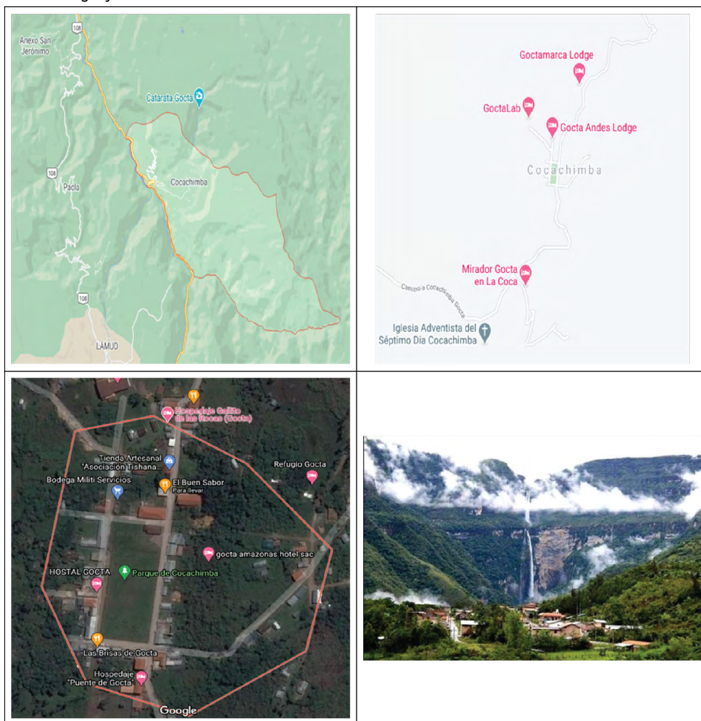
Figura 1. Ubicación Geográfica del Anexo de Cocachimba

La catarata de Gocta es un lugar con gran magnetismo debido a la mística que evidencia, y el esplendor natural que despliega por medio de las 110 especies de aves y mamíferos que aborda dentro de sus límites; donde para poder disfrutar de ello, se debe realizar una caminata por los bosques, partiendo del pueblo de Cochachimba o desde el pueblo de San Pablo, pues son las localidades más próximas, siendo un total de cinco horas de trayecto, incluyendo ida y vuelta. En tanto, para ir desde Cocachimba a Gocta (segunda caída) se tiene que realizar otro trayecto con una duración de 2 h 30 min aproximadamente (a pie o cabalgando) teniendo una distancia de seis kilómetros (Perú Travel , 2020).