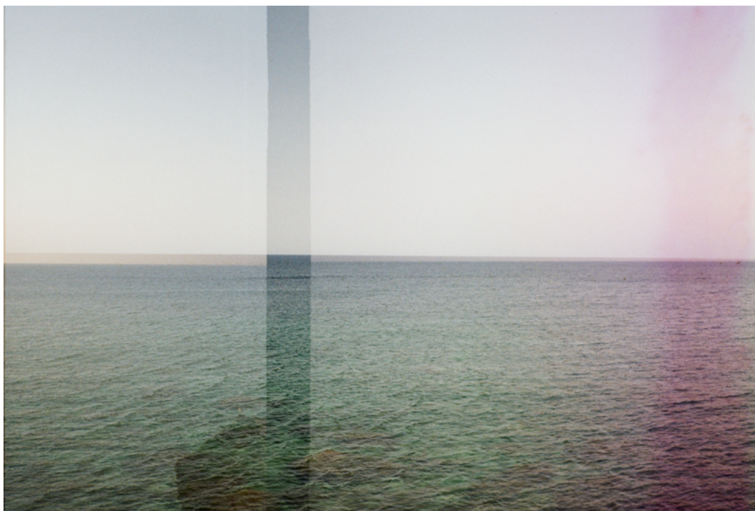
Fotografía: Fabrizio Contarino, 2025