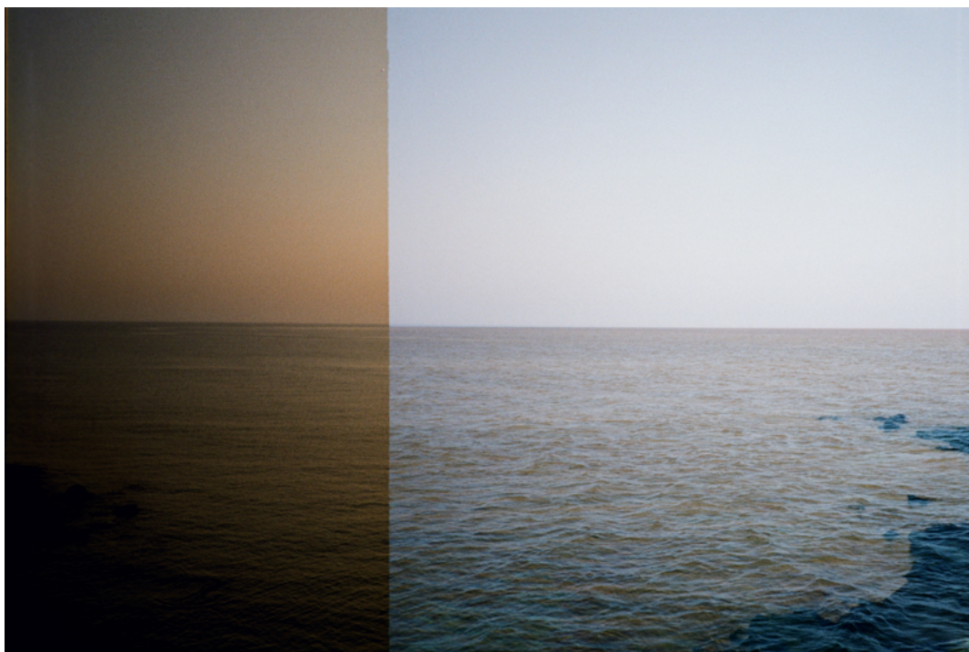
Figura 10 Líneas de fuga (detalle fotografía).