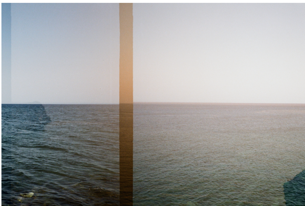
Figura 11 Líneas de fuga (detalle fotografía).